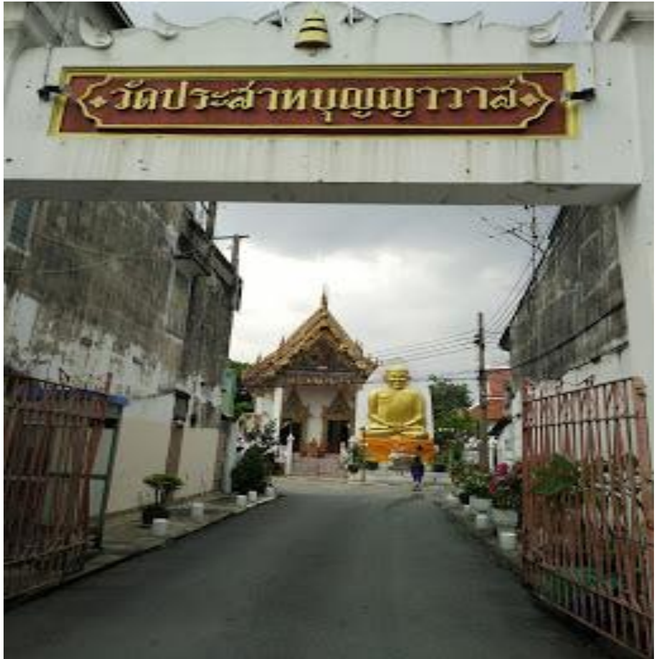
วัดประสาธตบุญญาวาส

๓.สถานที่สำคัญของชุมชนทำน้ำสามเสน แขวงวชิรพยาบาล เขตดุสิต กรุงเทพฯ