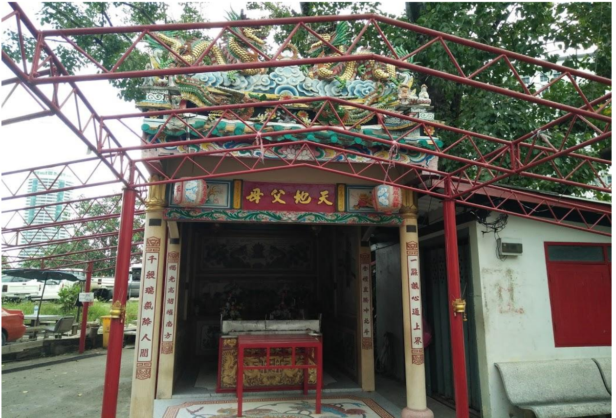
ศาลเจ้าพ่อตันโพธิ์