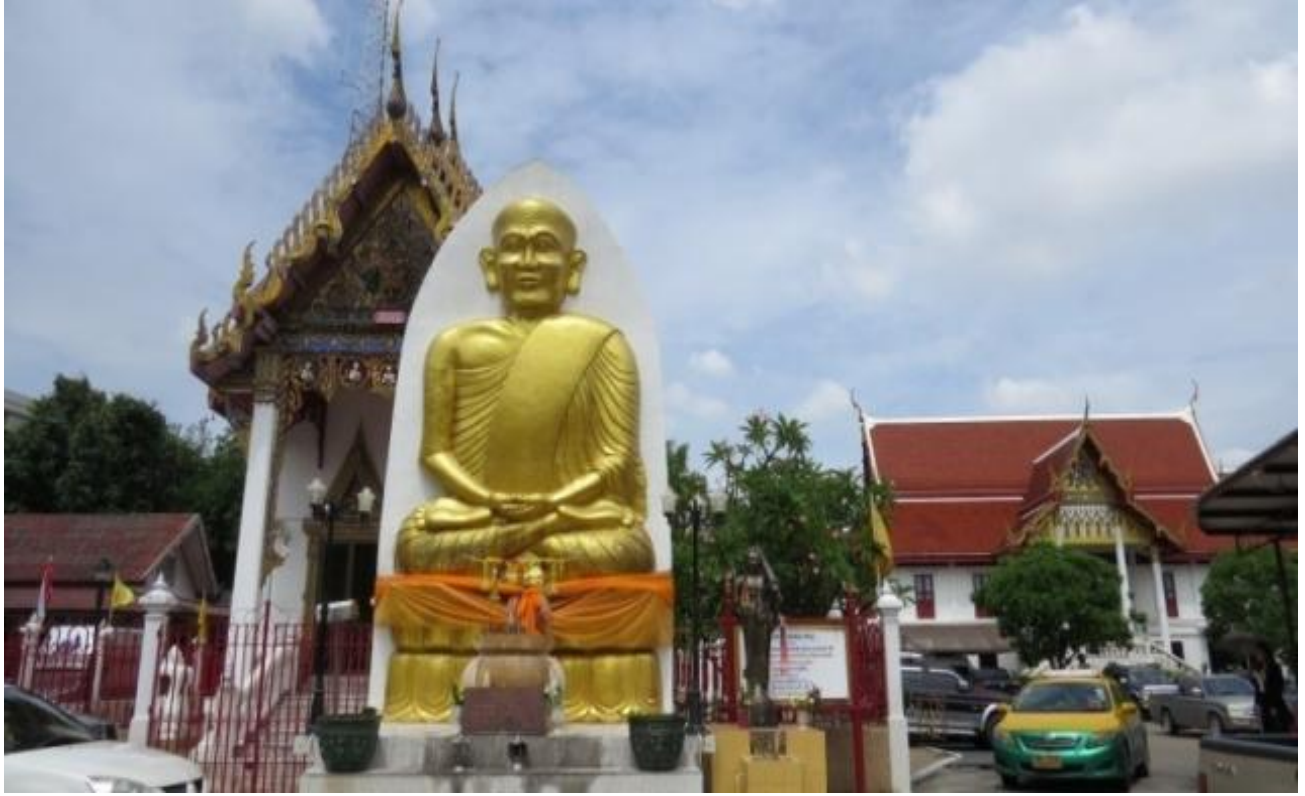
หลวงปู่ทวด วัดประสาธตบุญญาวาส