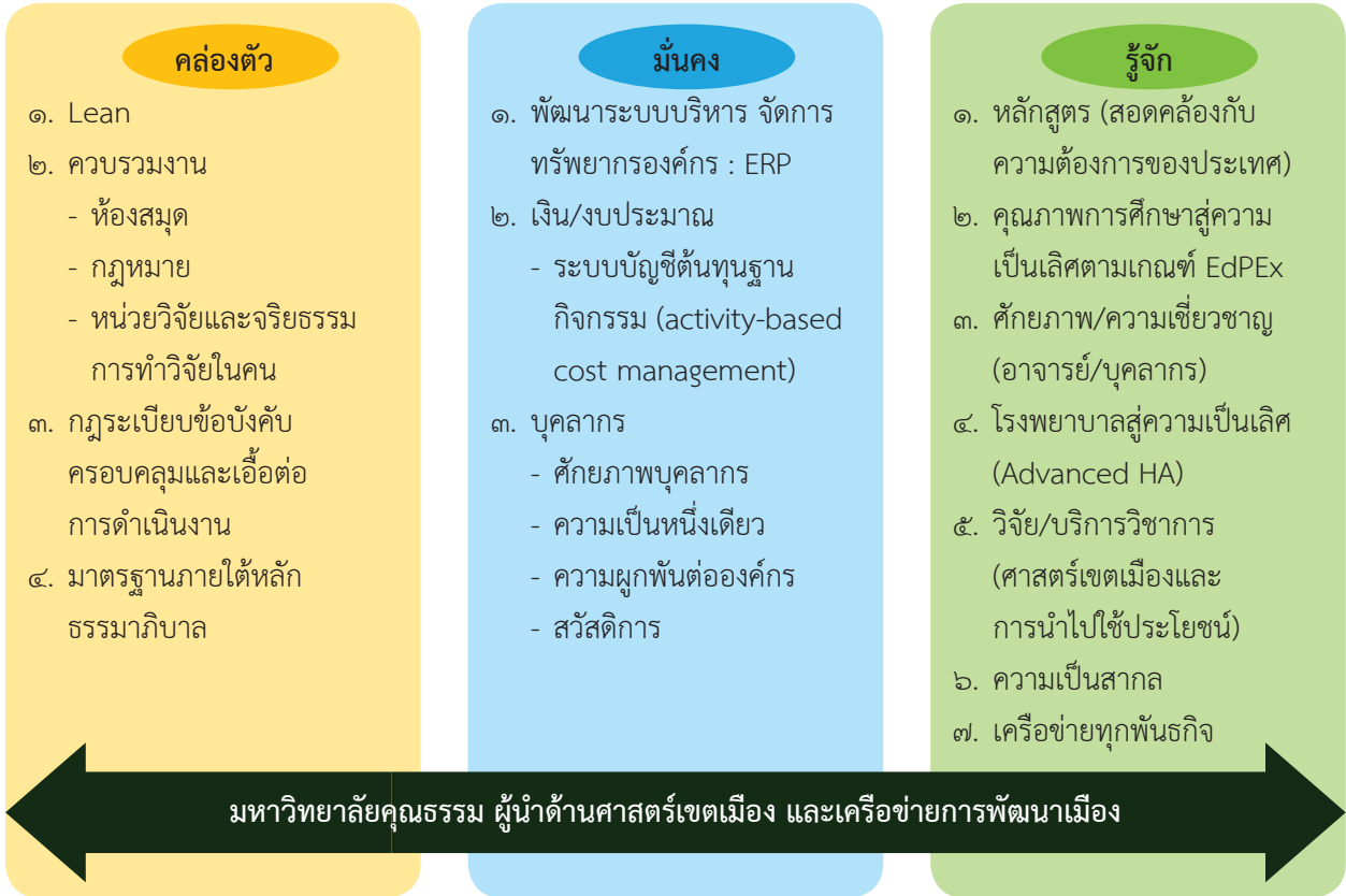
ภาพที่ ๑ การบริหารจัดการเพื่อให้เกิดความคล่องตัว มหาวิทยาลัยมีความมั่นคงและเป็นที่ยอมรับ

ส่วนท้องถิ่น ส่วนราชการต่าง ๆ องค์กรภาคเอกชน และสถาบันการศึกษาทั้งภายในประเทศและต่างประเทศ ในการดำเนินงานในทุกพันธกิจ ทั้งการผลิตบัณฑิต การปรับปรุงหลักสูตร การพัฒนาหลักสูตรใหม่ การบริการ วิชาการแก่สังคม การวิจัย ที่เน้นการพัฒนาศาสตร์เขตเมือง ซึ่งเป็นสหวิทยาการ (Multidisciplinary) เพื่อตอบโจทย์และความต้องการของสังคมและเมือง ตลอดจนการดำเนินงานบูรณาการศิลปวัฒนธรรมและการอนุรักษ์ ภูมิปัญญาท้องถิ่นร่วมกับหน่วยงานและชุมชนในเขตต่าง ๆ ของกรุงเทพมหานคร เน้นการนำจุดแข็งของ มหาวิทยาลัยนวัตกรรมธราธิราช ได้แก่ ความเชี่ยวชาญของอาจารย์ เนื่องจากมีคณะแพทยศาสตร์วชิรพยาบาล คณะพยาบาลศาสตร์เกื้อการุณย์ ซึ่งมีการจัดการเรียนการสอน ผลิตบัณฑิตสู่ระบบสุขภาพของกรุงเทพมหานคร มาอย่างยาวนาน ประกอบกับการเป็นมหาวิทยาลัยในกำกับกรุงเทพมหานครมีความใกล้ชิดกับกรุงเทพมหานคร ซึ่งมีบุคลากรที่มีความรู้ความเชี่ยวชาญหลากหลายด้าน ที่มหาวิทยาลัยให้ความสำคัญสำหรับการเป็นอาจารย์พิเศษ ร่วมถ่ายทอดความรู้และประสบการณ์ในหลักสูตรต่าง ๆ ในขณะที่มหาวิทยาลัยพร้อมให้การสนับสนุนการเข้าสู่ ตำแหน่งทางวิชาการของอาจารย์พิเศษเหล่านี้ นอกจากนี้กรุงเทพมหานครยังมีอาคารสถานที่ วัสดุอุปกรณ์ พร้อมสำหรับเป็นห้องปฏิบัติการและสถานที่ฝึกงานสำหรับนักศึกษาหรือผู้เข้ารับการอบรมในหลักสูตรที่เกี่ยวข้อง ศาสตร์เขตเมืองในด้านต่าง ๆ